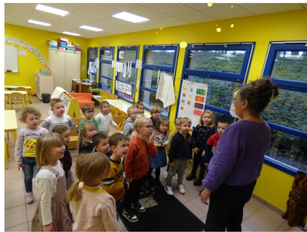
La chorale de l'école