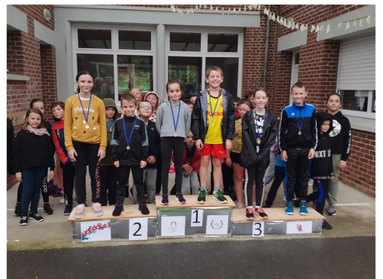
Le podium du Cross