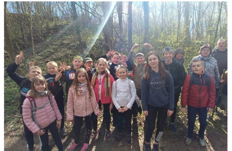
Randonnée à Pihem