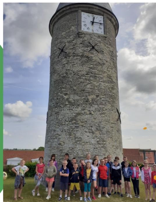
Sortie scolaire Tour de l'horloge de Guines