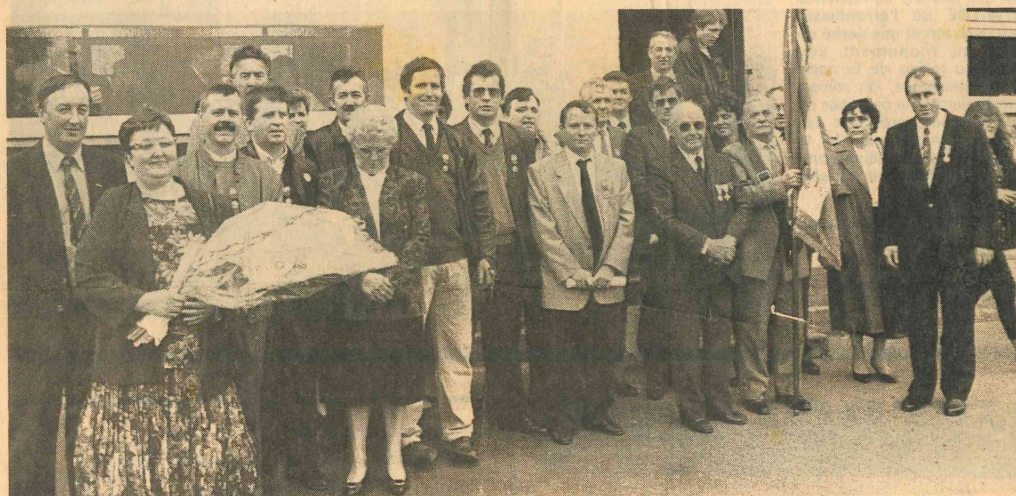
Les médaillés du 8 mai.