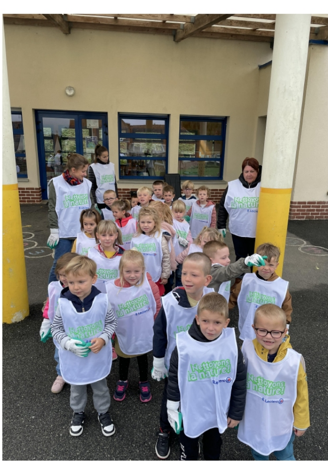
Nettoyons la nature