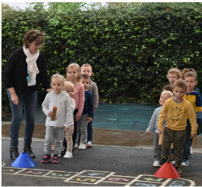
Olympiades chez les maternelles